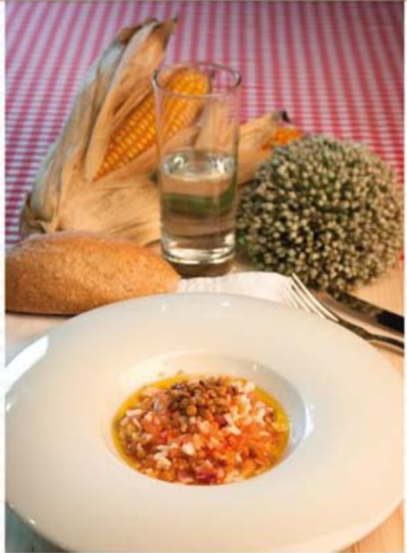
* Lentejas estofadas con arroz

Filete pequeño de merluza Tomate asado al horno Pan