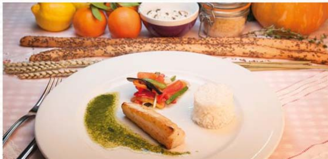
* Pisto de verduras al horno con bacalao

Ingredientes: 80 g de patata, 60 g de acelgas, 50 g de brécol, 40 g de puerro, 40 g de judías verdes, 30 g de zanahoria y aceite.