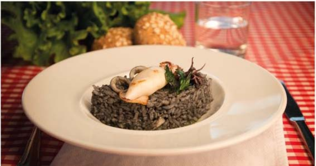
* Arroz negro con sepia y calamares

Filete de cerdo magro y coles de Bruselas al vapor. Ingredientes: 75 g de filete de cerdo, 50 g de coles de Bruselas y aceite.