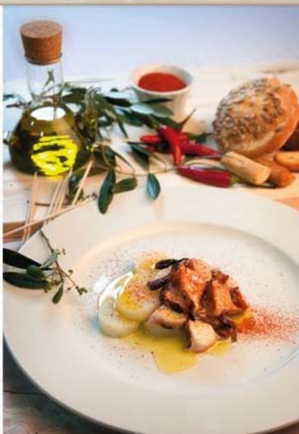
* Pulpo á feira con patatas

Filete de ternera a la plancha con guarnición de arroz y hortalizas al vapor 2 ciruelas verdes Pan