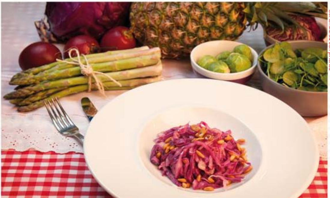
* Col lombarda con piñones

Ingredientes: 60 g de pan, 50 g de queso e 50 g de membrillo.