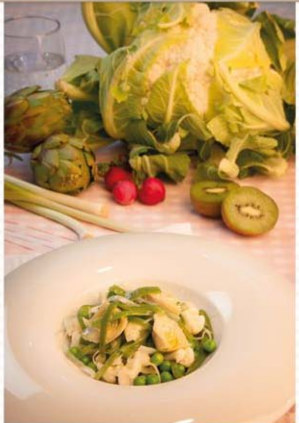
* Menestra de verduras