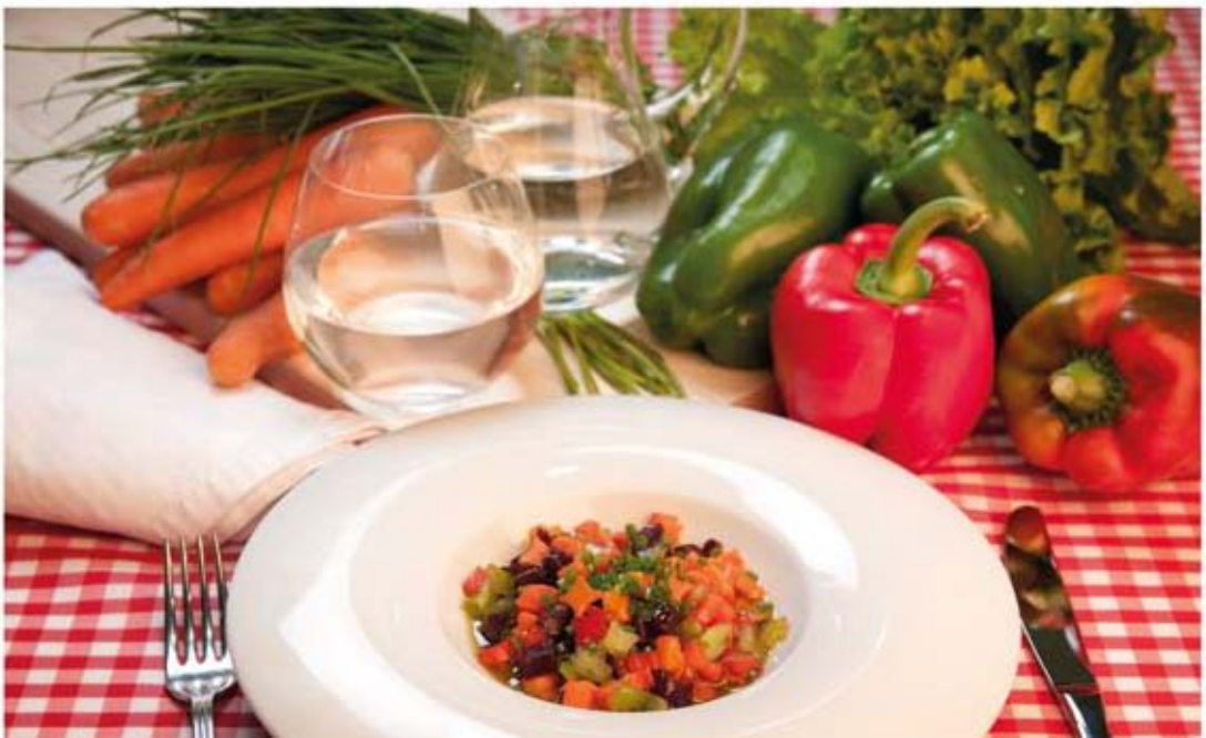
* Ensalada de zanahoria

Ingredientes: 100 g de calabaza, 100 g de patata, 90 g de leche, 75 g de zanahoria y aceite.