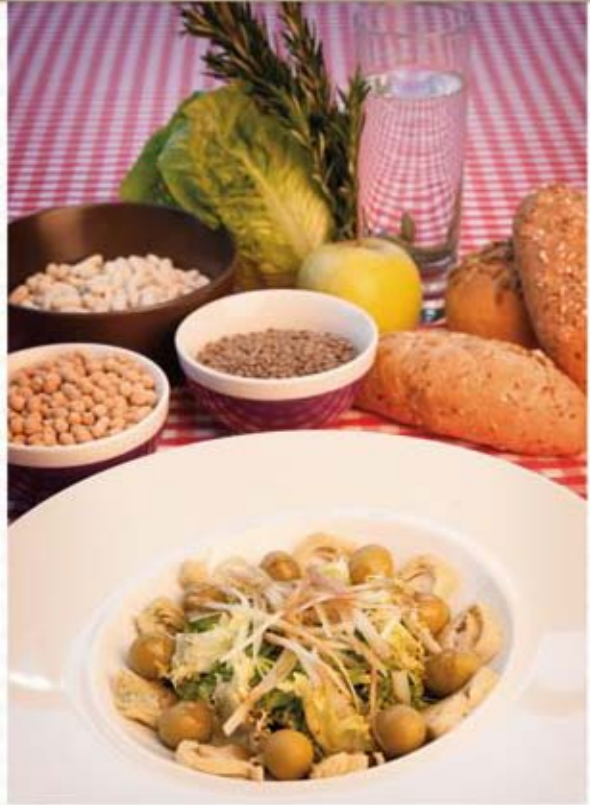
* Ensalada de invierno

Sopa de pescado con arroz Queso fresco (45 g) con 2 pasas Pan