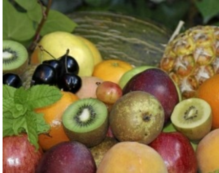
Frutas y verduras

Valenzuela también se suma a esta afirmación: "Comer bien es un placer. No solo se come bien para prevenir,