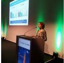
Un nuevo cribado cromosómico permite reducir el...