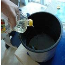
Canadá.- El aceite de colza puede ayudar a las...