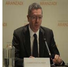
Aborto.- Gallardón asegura que la discapacidad...