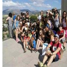
Andalucía.- Alcer organiza en Málaga el...