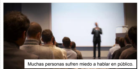
Muchas personas sufren miedo a hablar en público.