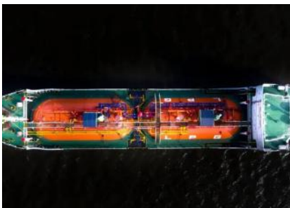
Hay 10 millones de barriles de petróleo ruso cerca de Corea del Sur que no tienen adónde ir