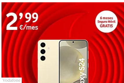
Samsung Galaxy S24 5G Negro 256GB ¡al mejor precio!

Hoy decimos 'adiós' a la factura en papel pero... Aprovecha la oferta