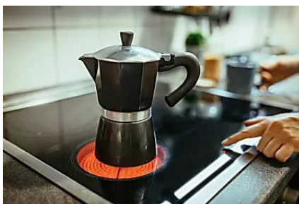
¿Qué pasa si pones leche en lugar de agua en una cafetera?