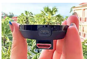
Smart TV Increíble, el decodificador de TV del que todos hablan...