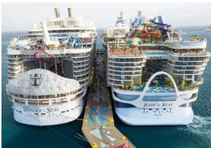
Estas fotos muestran el Icon of the Seas y el Wonder of the Seas de Royal Caribbean uno al lado del otro: así se comparan los dos cruceros más grandes del mundo