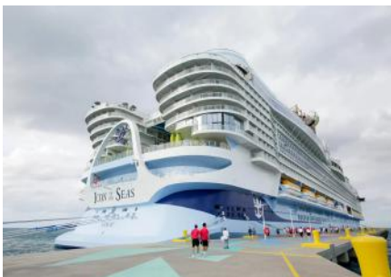
He sido una de las primeras pasajeras del Icon of the Seas de Royal Caribbean: 9 cosas que debes saber sobre cómo es el crucero más grande del mundo