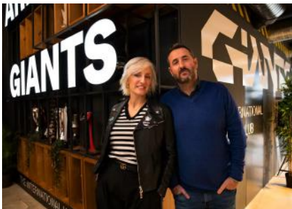
Los dueños de PcComponentes adquieren la malagueña Atlas, parte de la historia viva del 'gaming' en España

Descubre más sobre Andrea Núñez-Torrón Stock , autor/a de este artículo. Conoce cómo trabajamos en Business Insider.