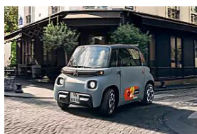
Citroën Ultra compacto