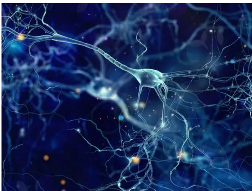
Imagen que representa las neuronas, el principal tipo de célula presente en nuestro cerebro.

Cabe destacar que para los expertos este Sistema Nervioso Entérico es de lo más complejo que se encuentran en el Sistema Periférico. Por eso, todavía son muchas las investigaciones que se están llevando a cabo sobre su efecto en nuestro organismo. Lo que sí se sabe, es que se encarga de la motilidad y secreción gastrointestinal . Todas estas neuronas son las que hacen que nuestro aparato digestivo siga su ciclo desde el esófago hasta el recto. Y, además, nos advierten del hambre y la saciedad .