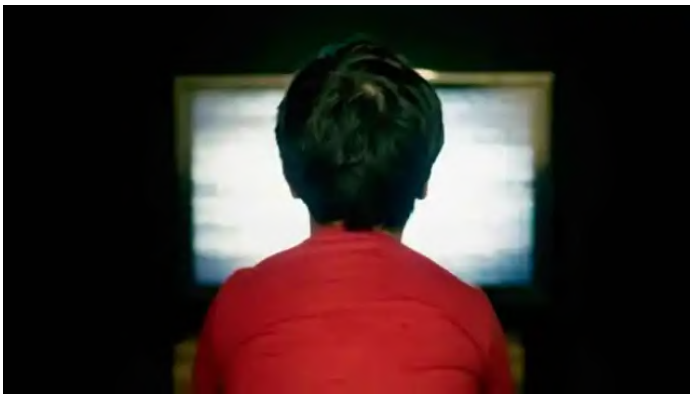
El 24,4% de los jóvenes españoles ve porno con violencia física: accede a él a los 13 años de media