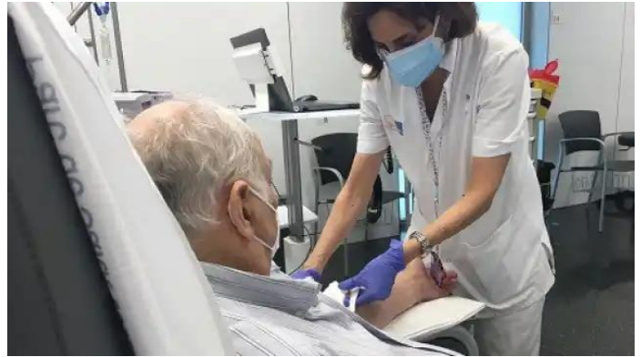
Europa investiga 23 casos de cáncer hematológico por su posible relación con las terapias CART