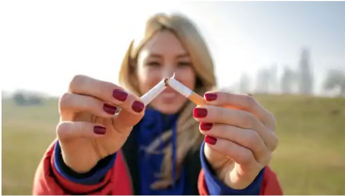
El reto de dejar de fumar: una misión que nos concierne a todos